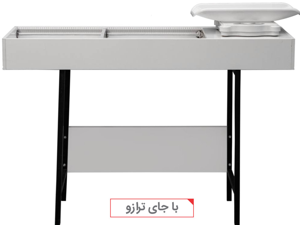
با جای ترازو

۱۰. در صورت درخواست تشک چرمی بر روی میز قدسنج به صورت سفارشی پذیرفته می شود.